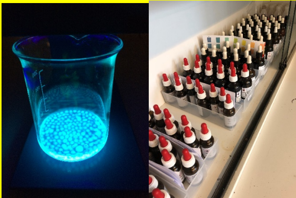
Farbstoff aus Markern wird untersucht