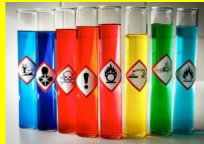
Die Gefahrensymbole (=Piktogramme) auf den Reagenzgläsern lernst du kennen.